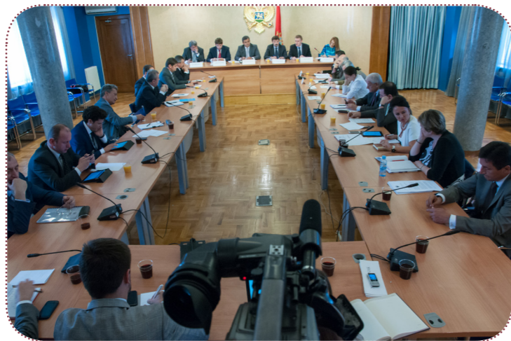
Zajednička sjednica Odbora za međunarodne odnose i iseljenike i Odbora za evropske integracije

Primarna dužnost poslanika u reprezentativnoj demokratiji jeste da zastupa građane, njihove stavove i interese. Istovremeno, parlament, kao izraz građanske volje i najviše predstavničko tijelo, mora omogućiti aktivno učešće građana u parlamentarnom životu. Ovaj princip nameće zahtjev da rad parlamenta bude javan, a da posebna pažnja bude posvećena jačanju kulture otvorenosti i dostupnosti institucije građanima. U Skupštini Crne Gore ovaj princip se ogleda u saradnji sa civilnim sektorom u okviru koje predstavnici civilnog društva mogu prisustvovati sjednicama radnih tijela. Redovne aktivnosti na ovom polju obuhvataju i objavljivanje relevantnih informacija i dokumenata nastalih u radu parlamenta na skupštinskim internet stranicama, objavljivanje strateških dokumenata, godišnjih i drugih izvještaja o radu, finansijskih izvještaja, biltena i drugih publikacija, prenos skupštinskih sjednica, te grupne i pojedinačne posjete građana. Čvršćoj vezi između parlamenta i građana i jačanju povjerenja u instituciju doprinosi i slobodan pristup informacijama.