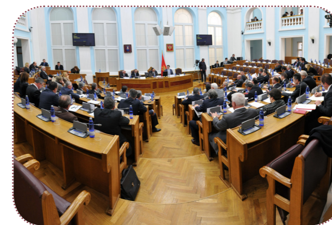
Prva sjednica redovnih zasjedanja Skupštine Crne Gore održava se u Prijestonici Cetinje

Skupština radi na redovnim i vanrednim zasjedanjima. Redovno zasjedanje održava se dva puta godišnje, u skladu sa Poslovnikom Skupštine. Prvo redovno zasjedanje počinje prvog radnog dana u martu i traje do kraja jula, a drugo prvog radnog dana u oktobru i traje do kraja decembra. Vanredno zasjedanje saziva se na zahtjev najmanje trećine ukupnog broja poslanika, predsjednika Crne Gore i predsjednika Vlade.