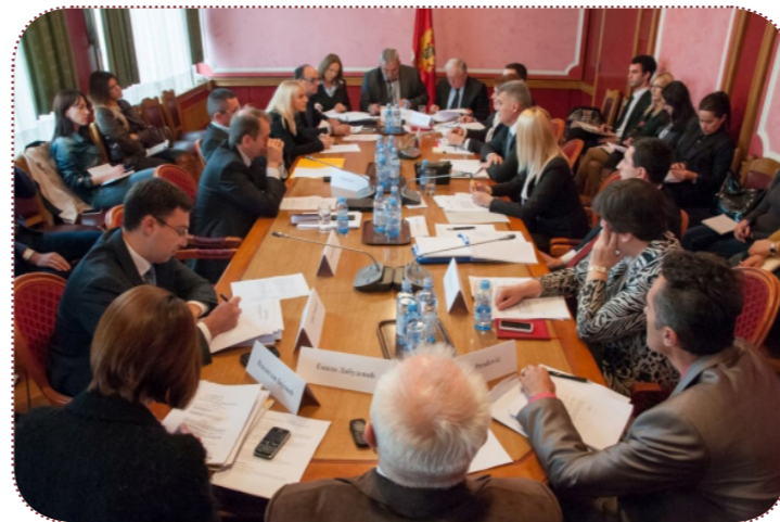
Sjednica Zakonodavnog odbora