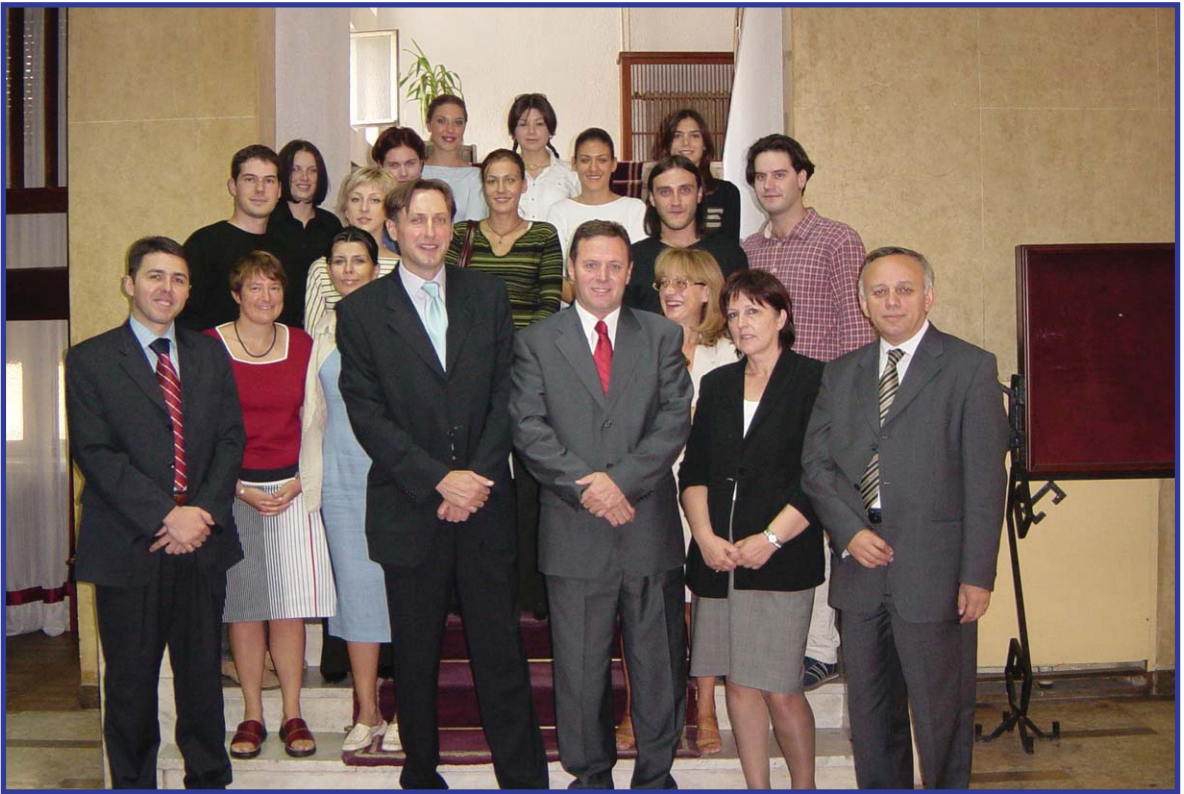
▪ koordinatori i polaznici Internship programa sa rukovodstvom Skupštine RCG

U septembru 2003. godine projekat "Otvoreni parlament" je obogaćen novom aktivnošću – Internship programom, programom stažiranja studenata u Skupštini Republike Crne Gore. Pored kvalitetne saradnje koju ostvarujemo sa Nacionalnim demokratskim institutom i Skupštinom RCG, u realizaciji Internship programa imamo i novog važnog partnera – Univerzitet Crne Gore. Ovaj program studentima omogućava da u direktnom kontaktu saznaju mnogo o ovoj važnoj instituciji, da steknu praktična znanja neophodna za budući profesionalni angažman, ali i da konkretno doprinesu radu parlamenta kroz obavljanje administrativnih