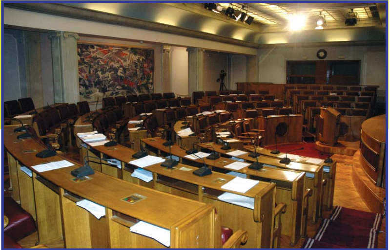
■ Plenarna sala

* Iz parlamentarne prakse drugih zemalja