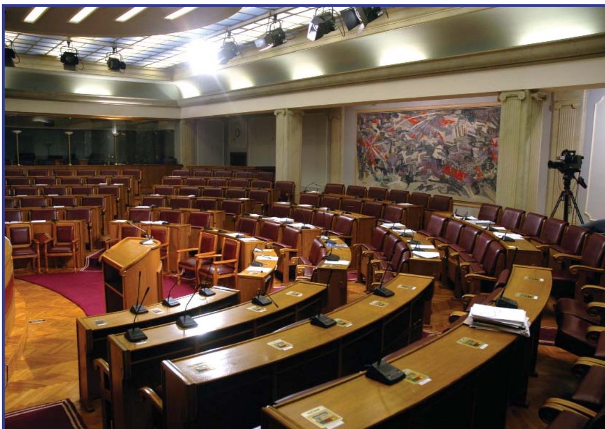
■ Plenarna sala